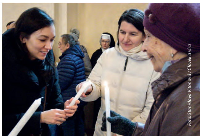
Na začátku obřadu přítomní zažehli svíce.