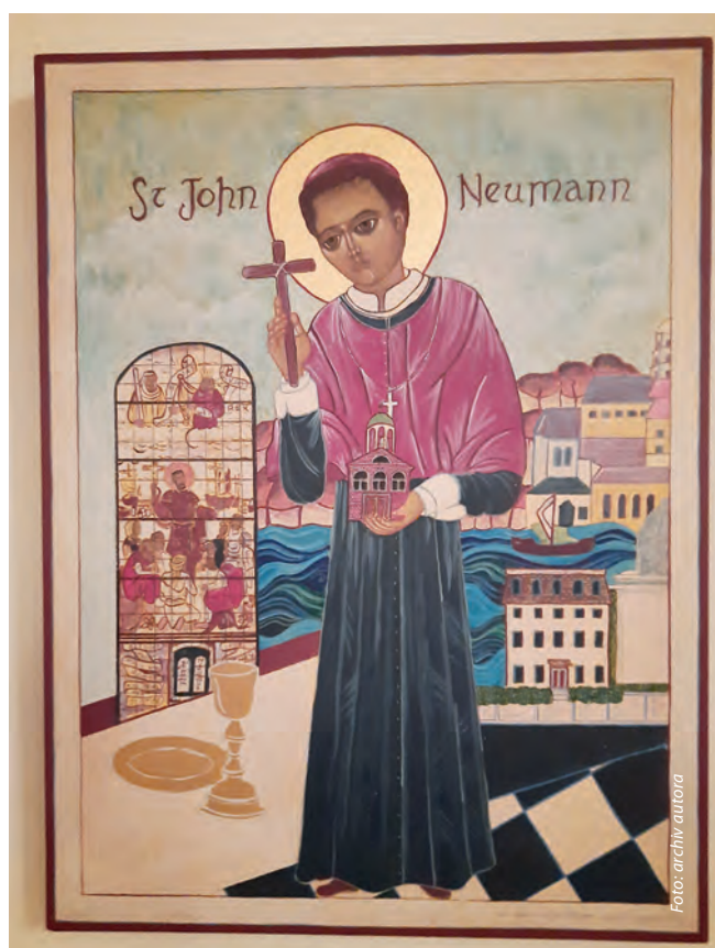
Obraz sv. Jana N. Neumanna v kostele sv. Františka Xaverského, Gettysburg, Pensylvánie, USA.

Svým náhlým a nečekaným odchodem jsem měl skutečně v úmyslu pouze zmírnit bolest z odloučení, které jsem chtěl předejít nejen kvůli vám, ale také kvůli sobě. Přesvědčen, že vaše rodičovské požehnání mě bude provázet všude za všech okolností, zdržel jsem se jeho otevřeného vyžádání a jsem si stejně jistý, že přijmete díky, které vám všem dlužím za tolik nekonečných dobrodiní, a které vám tímto písemně z celého srdce vzdávám, stejně jako kdybych je vyjádřil slovy.