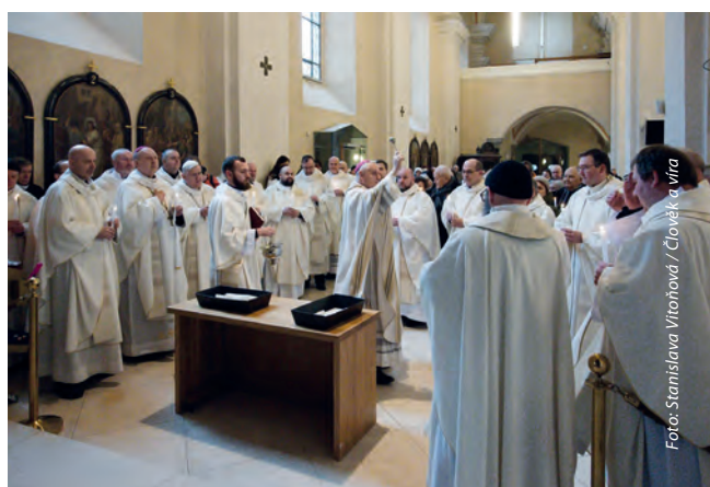
Diecézní biskup posvětil zapálené svíce.