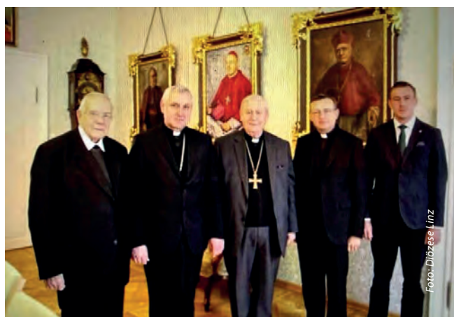
Návštěva na lineckém biskupství 21. prosince 2015 u příležitosti vyzvednutí betlémského světa. Zleva: emeritní linecký biskup Maximilian Aichern, českobudějovický biskup Vlastimil Kročil, linecký biskup Ludwig Schwarz, děkan Zdeněk Mareš a biskupský sekretář David Mikluš.

možné rozloučit do 19:00 hodin a v pondělí od 8:00 do 14:00 hodin. V neděli večer v 18:00 hodin proběhne u rakve biskupa modlitba nešpor. V pondělí 9. února 2026 bude ve 14:00 hodin v klášterním kostele slavena zádušní mše svatá. Poté bude biskup Maximilian pohřben v opatské hrobce klášterního kostela.