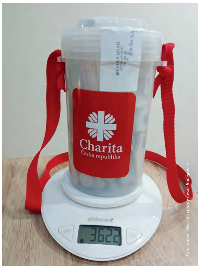
Nejtěžší letošní pokladničku naplnili koledníci ze ZŠ a MŠ Sezimovo Ústí.