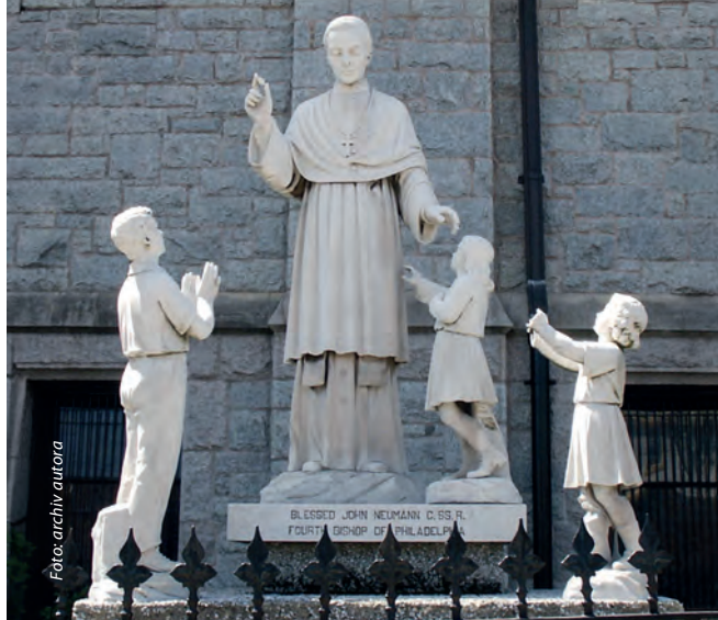
Sousoší se sv. Janem N. Neumannem v The National Shrine of St. John Neumann, Filadelfie, Pensylvánie, USA.