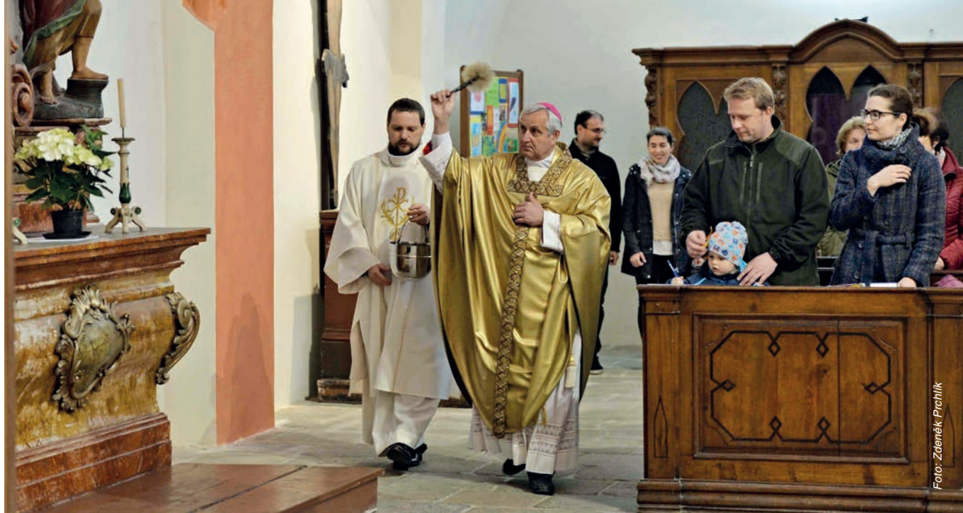
Biskup Vlastimil Kročil posvětil 1. května kostel Proměnění Páně v Táboře u příležitosti jeho otevření po rekonstrukci