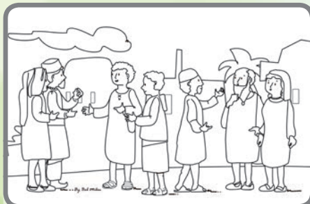
S pomocí Ducha Svatého vyprávěli apoštolové všem o Ježíši.