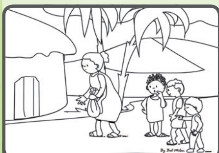
Cristine z Madagaskaru: „Máme v sousedství staří paní, která je trochu zvláštní. Děti si z ní dělají legraci a ona se kvůli tomu s nikým nebaví.“