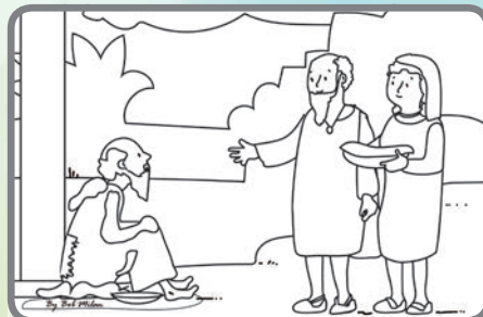
Lidé jim naslouchali a z jejich příkladu se učili, jak žít jako Ježíš.