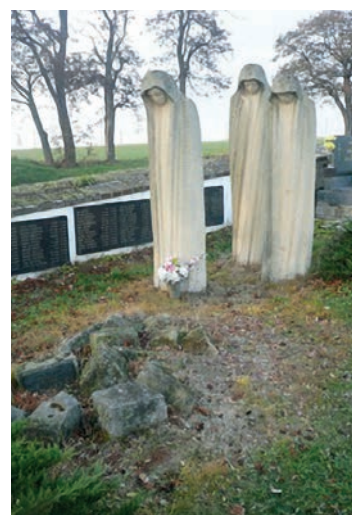
Smutnicí ženy – hřbitov Mirovice