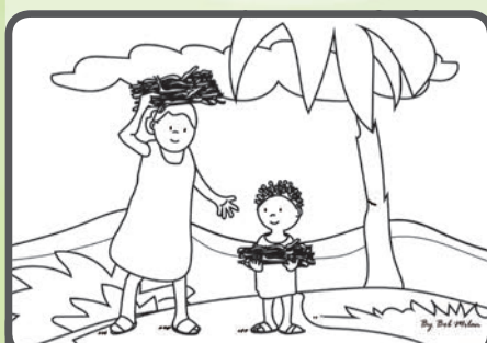
Jednoho dne jsem ji viděla, jak se vrací z pole s velkým svazkem dřeva na hlavě. Zeptala jsem se jí, jestli nechce pomoci. Po chvíli váhání mi dřevo podala.