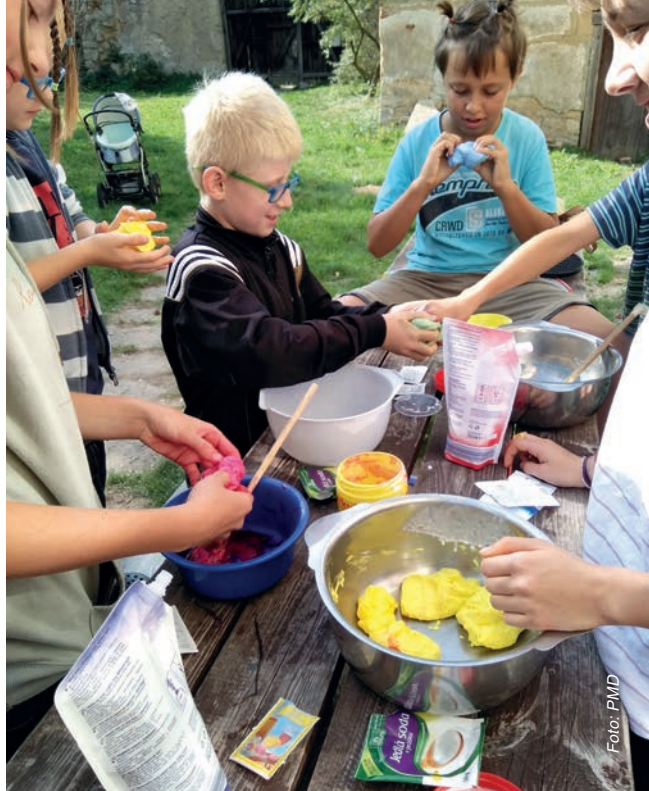
Nečtiny 2018 – vyrábění pro radost i misie

Hrubý nástin programu je takový, že dopoledne trávíme společně na faře od ranních chval v kapli přes dopolední duchovno, rozhovory ke mši svatě a obědu. Odpoledne vyrážíme buď společně, nebo jak kdo chce na výlety do blízkého či vzdáleného okolí. Večerní program určitě spojíme aspoň jednou s OMI mladými, kteří v tom týdnu ve vedlejším Manětíně pořádají setkání s prací pro druhé Workshop (a na večer mají pozvaného Vítu Marčíka, dětské dopoledne atd.). Stravujeme se společně - každý den vaří jedna rodina. Ubytování je romantické a mládežnické, nečekejte žádný luxus, ale o to větší zážitky. Jestli se nám podaří domluvit, účast-