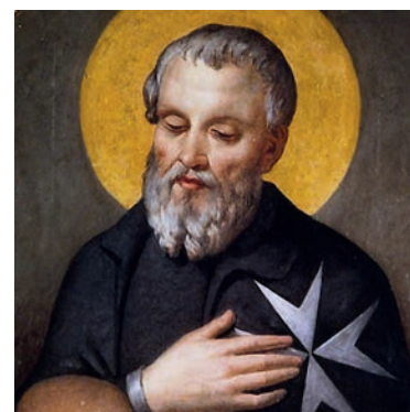
Blahoslavený Gerard, přibližně (1140–1120)

odpluli nejprve do Itálie, aby později vstoupili na Maltu, kterou řádu věnoval císař Karel V.