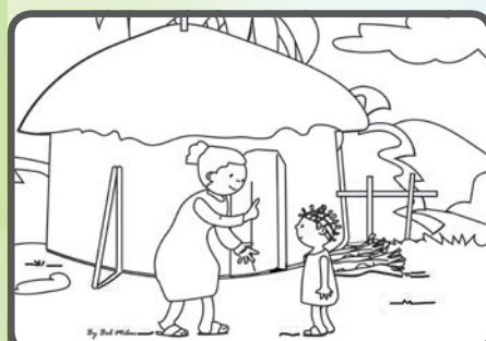
Měla jsem sílu donést jí dřevo až domů. Když jsme tam došli, řekla mi: „Bůh ti žehnej.“ Měla jsem velkou radost.

Pán Ježíš slibuje apoštolům, že dostanou od Boha sílu Ducha sva- tého, aby mohli být jeho svědky po celém světě a až na konec země. To samé očekává od každého z nás. Říká: „..... a .....“ (viz tajenka) Boží království.“