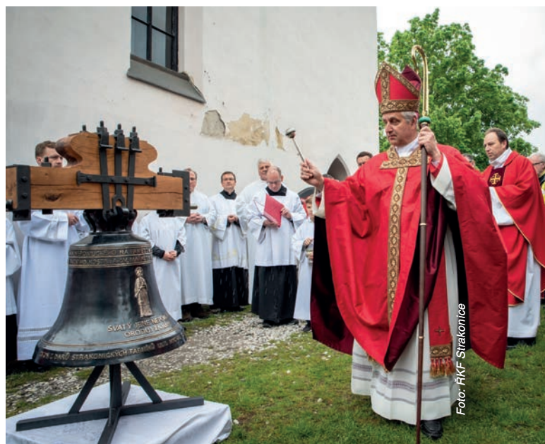
Biskup Vlastimil Kročil požehnal nový zvon sv. Jan Nepomucký

Na závěr bohoslužby strakonický farář poděkoval za požehnaní zvonu biskupu Vlastimilu Kročilovi, všem účastníkům, ale především dárcům, díky nimž můžeme zvonu žehnat a především po celá desetiletí a staletí naslouchat. Když vycházel liturgický průvod a účastníci bohoslužby z kostela,