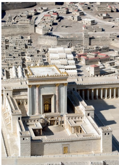
Model Druhého chrámu v Izraelském muzeu v Jeruzalémě. V letech 518 př. n. l. - 70 n. l. nahradil zničený Šalomounův chrám.

Předchozí prorocké knihy tuto výhodu neměly: byly volně umístěny do doby vlády nějakého krále, bez jakéhokoli dalšího upřesnění; nevíme, komu byly adresovány ani čeho se přesně týkaly. Na rozdíl od předchozích proroků se o Ageovi dočteme i jinde ve Starém zákoně. Doba, v níž Ageus působil, je popsána v knize Ezdráš, a tato kniha také Agea zmiňuje: „ Proroci Ageus a Zacharjáš, syn Idův, prorokovali židům v Judsku a v Jeruzalémě ve jménu Boha Izraele a napomínali je “ (Ezd 5,1); obdobně Ezd 6,14 říká, že „ židovští starší stavěli a dílo se jim dařilo, jak prorokovali proroci Ageus a Zacharjáš, syn Idův “. Z dějepisných knih Ezdráš a Nehemjáš a z prorocké knihy Zacharjáš známe i Zerubábelu, syna Šealtíelova, a prorok Zacharjáš hovoří i o veleknězi Jóšuovi.