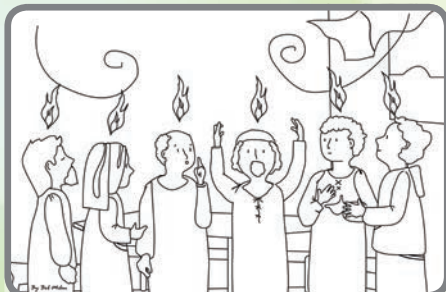
Jak Ježíš slíbil, seslal na apoštoly po svém vzkříšení ucha Svatého.

Obrázky si vybarvi a přemýšlej, jak bys podle toho mohl/a „žít“ i ty?