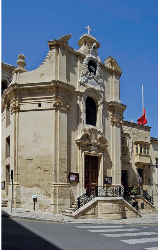
Kostel P. Marie Vítězné byl první kostel postavený 1566–1568 ve vznikající Vallettě po tureckém obléhání

Řád sv. Jana rozvinul během své existence v nebývalé míře vojenskou architekturu, která zastínila vše, co se stavělo v tehdejší Evropě. Promyšleným skloubením západního stylu vojenských staveb s východním vystavěli johanité největší a nejmocnější hrady na světě. Po prohrané IV. křížové výpravě a zejména po pádu města Akko, této poslední pevnosti rytířských řádů ve Svaté zemi, odcházejí rytíři sv. Jana na Kypr a posléze na Rhodos, který se stává na další téměř tři století jejich základnou. Rhodos se stal nejenom opěrným bodem, který po pádu Cařihradu odolával narůstajícímu muslimskému tlaku, ale byl rovněž prosperujícím a vzkvétajícím státem, jak se o tom může přesvědčit i současný návštěvník. Tradice rytířů sv. Jana je na tomto půvabném středomořském ostrově stále živá. I když byli rytíři po několikaletém obléhání sultánem Sulejmanem Nádherným v roce 1523 donuceni na základě mírové úmluvy ostrov opustit, stalo se to řádovou flotilou a s vlajícími prapory. Neporažení