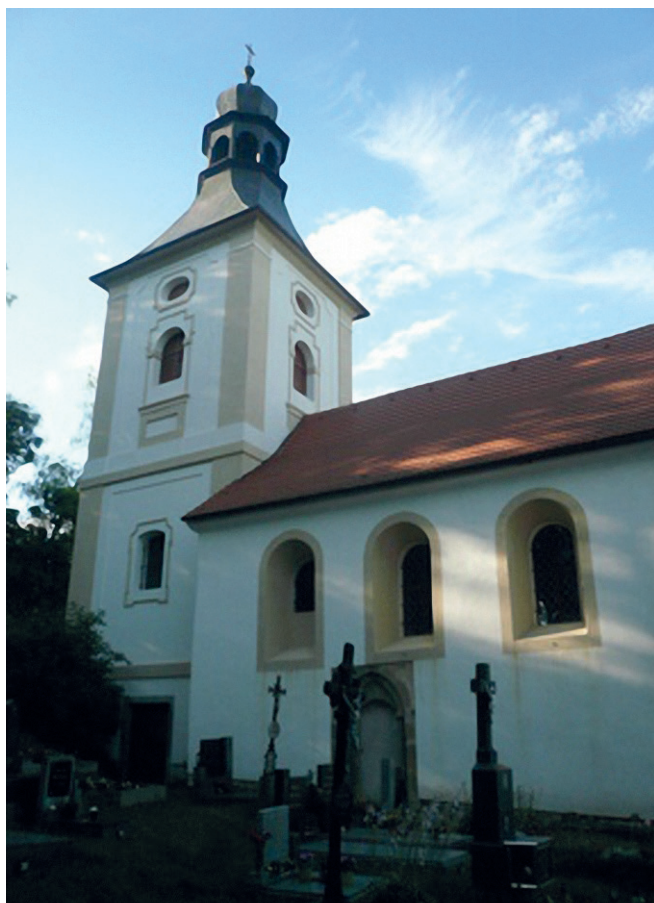
Kostelík na Stražišti