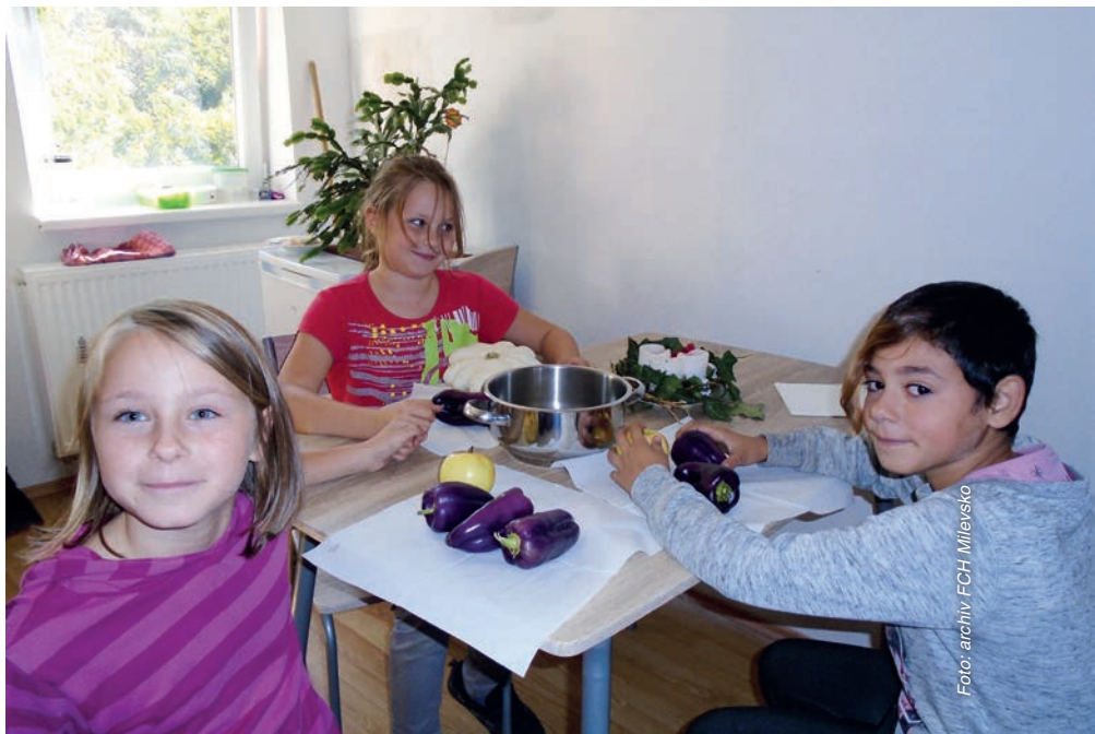
Děti v klubu Fanouš