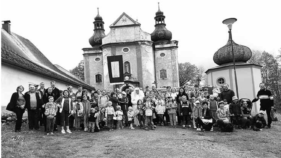
Fotografie z vikariátní pouti najdete na http://www.farnostsusice.cz

Odpoledne putovaly děti s rodiči po čtyřech stanovištích spojených s životem Panny Marie: Na prvním Školské sestry de N. D. připomněly modlitbu růžence. Druhé bylo věnováno Mariině pomoci Alžbětě a mládež ze