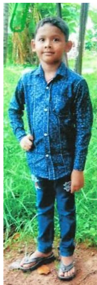
Enock 6 let Indie

Stejně jako děti do svých malých kasiček, které si vyrobily na náboženství, mohou i dospělí během adventu a Vánoc přispět na tyto děti do velkých kasiček v kostele.