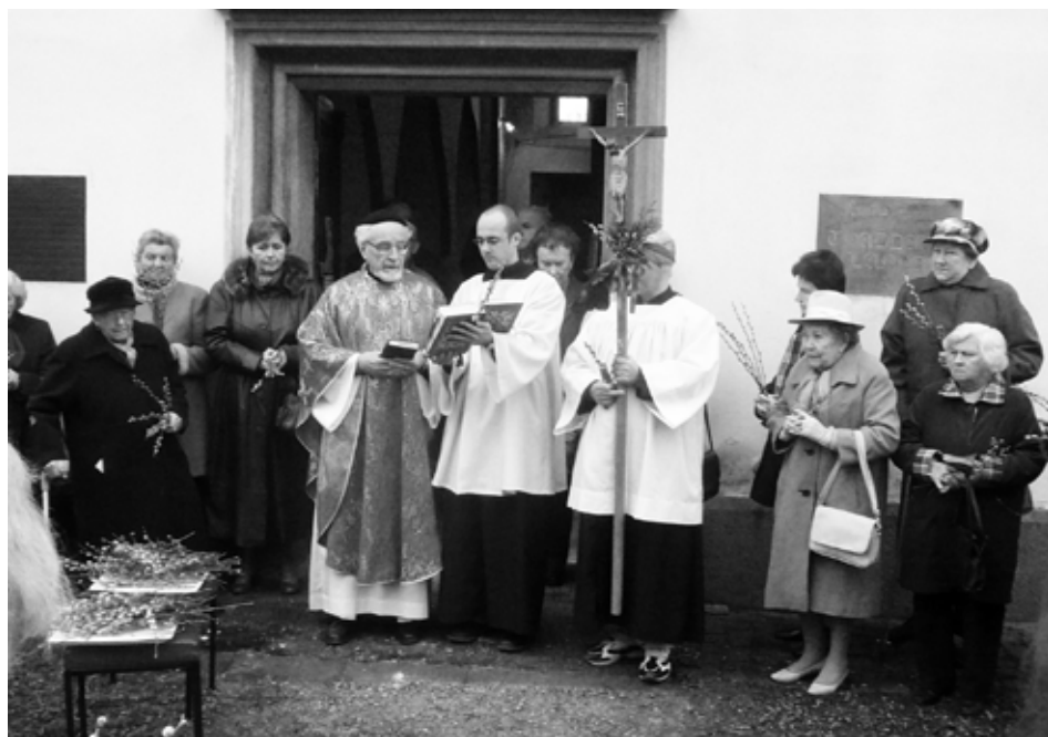
Květná neděle v kostele sv. Prokopa na St. městě v Českých Budějovicích.