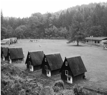
Pavlátova louka u Nového Města nad Metují

Bližší podrobnosti a přihlášky na adrese YMCA-Živá rodina, Na Poříčí 12, 110 00 Praha 1, tel. 224 872 421, zr@ymca.cz, www.ymca.cz